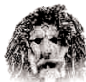
NARRENVEREIN Waldgoischter e.V.